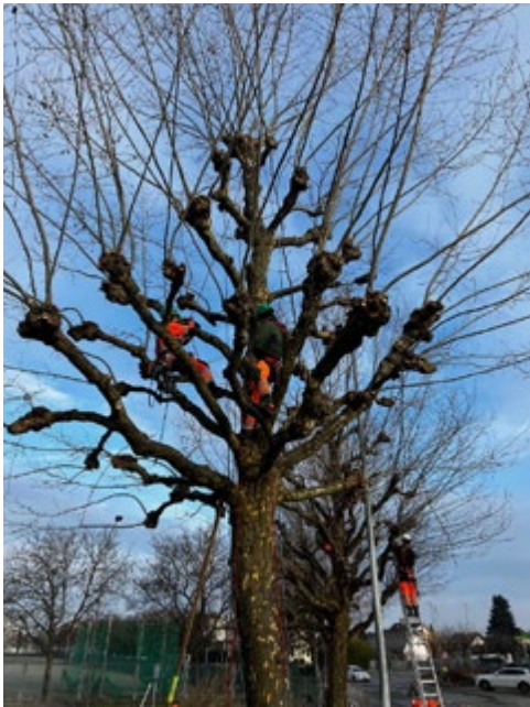
Taille des arbres