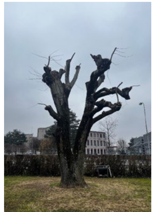
Exemple de taille portant préjudice à l'arbre

En cas de questions sur la taille ou sur une pratique visant à entretenir les arbres, le secteur Espaces verts se tient à disposition afin d'accompagner la population payernoise dans la conservation du patrimoine arboré.