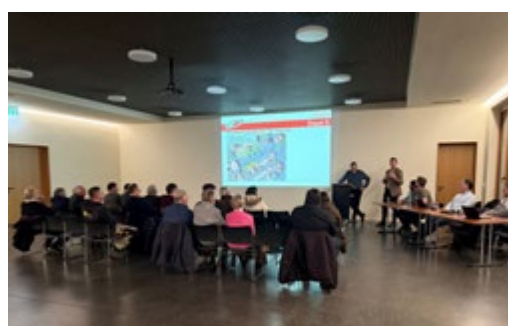
Séance d'informations aux riverains et propriétaires

Retrouvez toutes les informations sur les chantiers sur la page dédiée www.payerne.ch/chantiers .