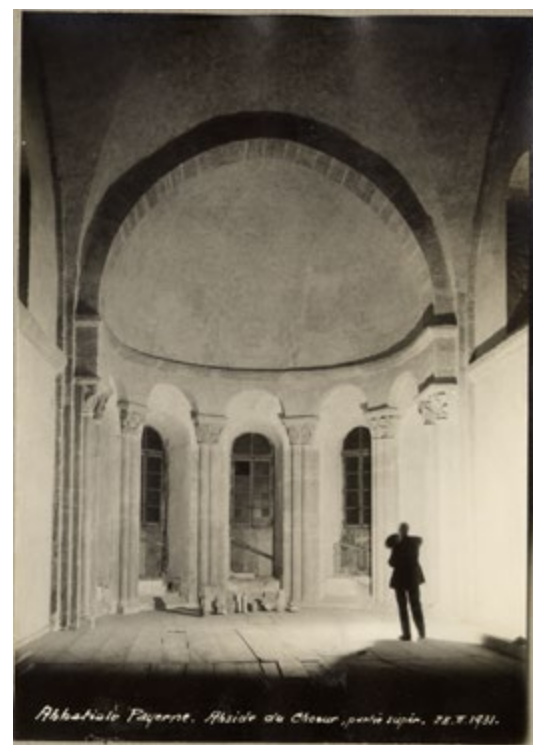
Photographie du chœur de l'Abbatiale en 1931 par Louis Bosset, © Archives communales de Payerne, reproduction Stégigraphic

Cet « avant/après » in situ promet un voyage dans le passé à travers une expérience immersive. L'exposition retracera le travail de fouilles et de restauration de l'Abbatiale, le parcours de Bosset en tant qu'archéologue cantonal, sa carrière d'architecte, ainsi que ses fonctions politiques (syndic de Payerne de 1929 à 1941) et publiques.