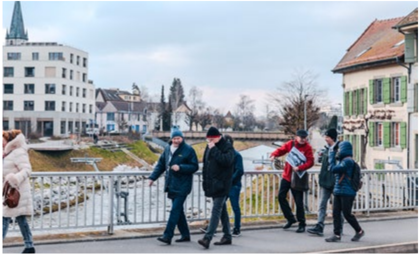
Balade du 1 er mars 2025