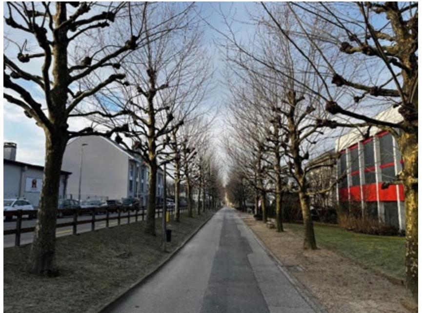
65 platanes à l'Avenue de la Promenade