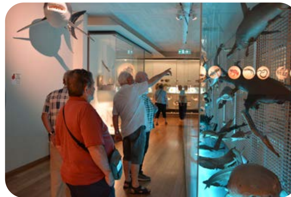
Visite au Musée d'Histoires Naturelles de Fribourg

C'est à la cafétéria de l'Université de Fribourg, en intérieur ou au frais sur la terrasse que nous avons pu partager un café ou une bière et savourer une petite collation.