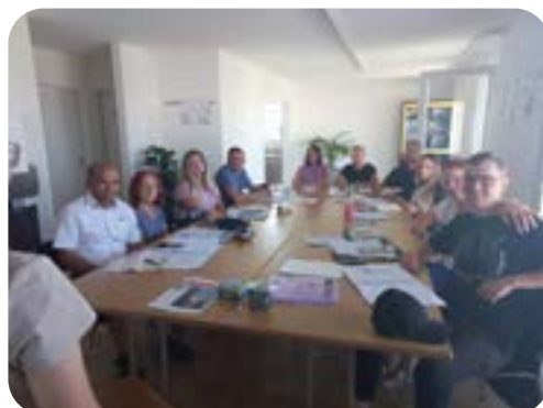
Des personnes ukrainiennes apprennent le français à Payerne

Ce sont des vendeuses, informaticienne et informaticiens, professeure de yoga, enseignante en école primaire, homme et femme d'affaires, économiste, répartitrice du réseau ferroviaire, professeure d'anglais, couturière, électromécanicien. Douze personnes venant d'Ukraine suivent des cours de français organisés par la Commune de Payerne sur mandat de l'Etablissement vaudois d'accueil des migrants (EVAM).