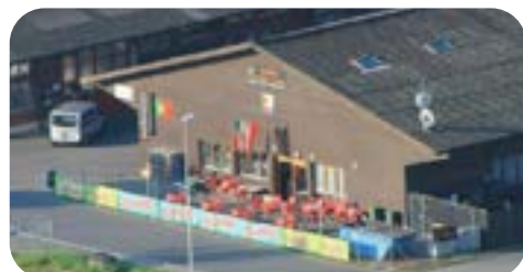
Vue aérienne du centre

Plusieurs dizaines de repas sont servis tous les jours ainsi que le week-end, des plats typiques portugais comme le poisson