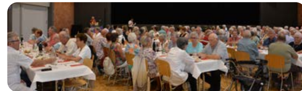
Repas à la Halle des Fêtes

À notre arrivée, nous avons pu visiter ce célèbre Musée fribourgeois, orné d'histoires et de différentes expositions relatant divers domaines des sciences naturelles.