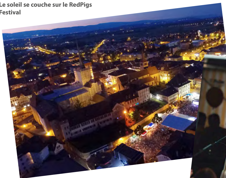
Le soleil se couche sur le RedPigs Festival