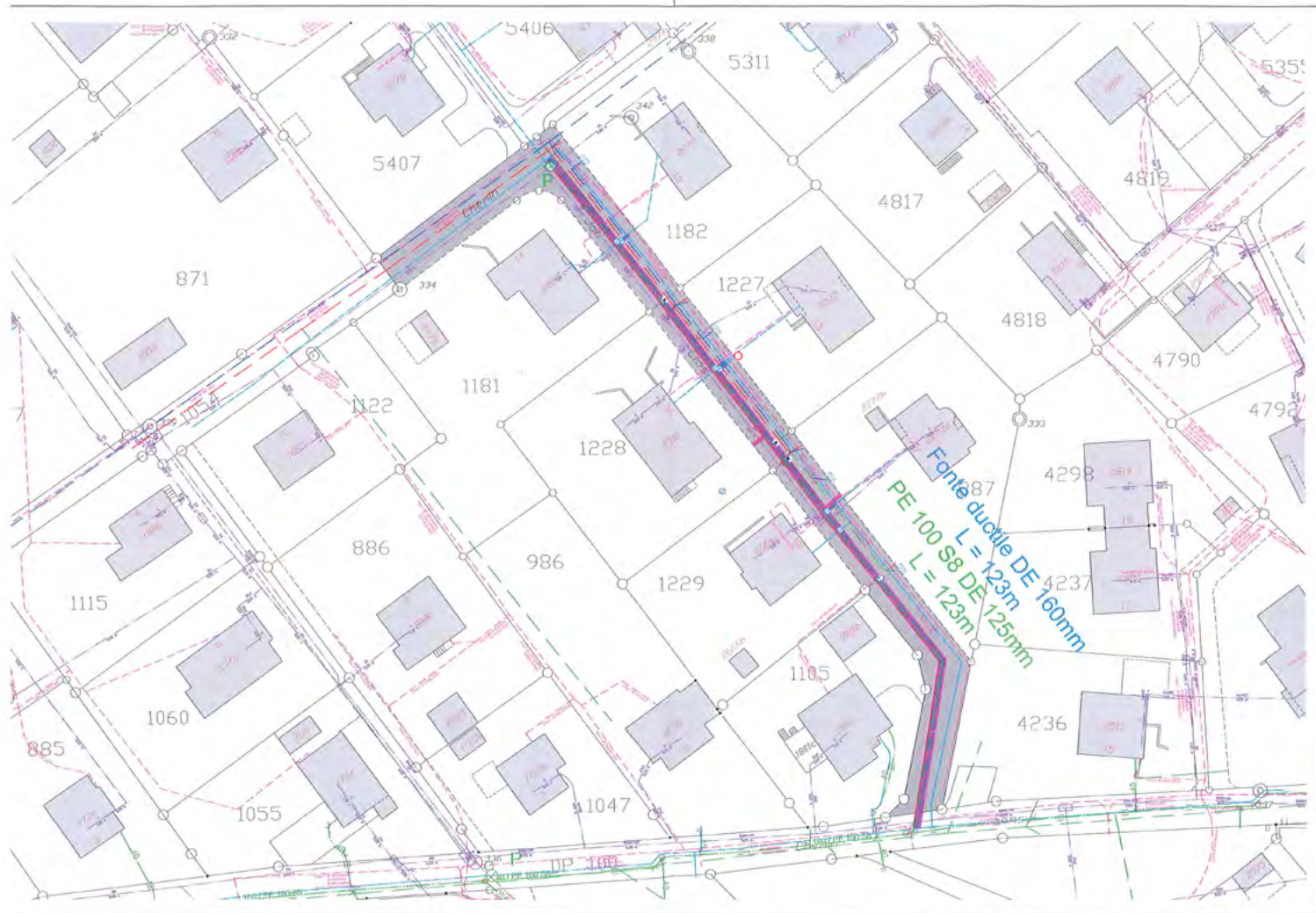
Travaux Chemin Joli-Clos