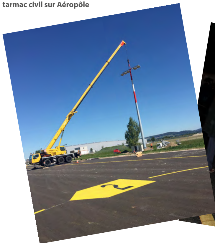
Pose des mâts d'éclairage du tarmac civil sur Aéroport