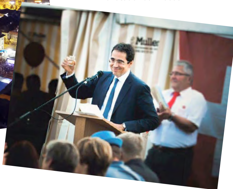
M. Darius Rochebin lors de son allocution du 1 er août